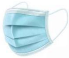
挂耳式医用外科口罩